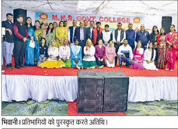
मिवानी। प्रतिभागियों को पुरस्कृत करते अतिथि।