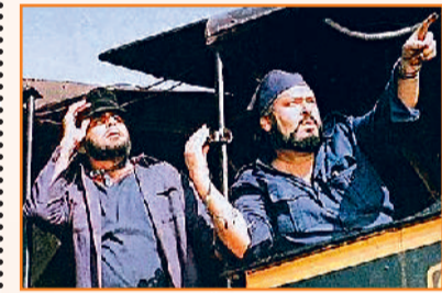
फिल्म 'विधाता' में दिलीप कुमार-शमी कपूर

लगातार बढ़ रही है डिमांड: हाल के सालों में बदलते मौसम में बाजार में शैकेट की लगातार मांग बढ़ रही है। क्योंकि कुछ वर्षों में ई-कॉमर्स प्लेटफॉर्म और लोकल ब्रांड ने अपनी नियमित क्लेक्शन में भी शैकेट को शामिल किया है। फैशन रिटेल से जुड़े जानकारों के मुताबिक यह ट्रेंडिजेशनल वियर यानी बदलते मौसम के समय का फैशन हर साल 15 से 20 फीसदी तक वृद्धि हासिल कर लेता है। इसकी बढ़ती मांग का एक कारण यह है कि यह मीडियम रेंज में उपलब्ध होता है। वियर करने पर बहुत सोबर और एलीगेंट लुक देता है। इसके अगर