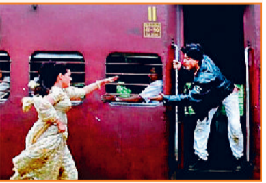
'दिलवाले दुल्हनिया ले जाएंगे' का क्लैडिमेक्स सीन