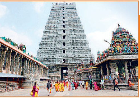
अन्नामलाईयार मंदिर, तिरुवनमलाई