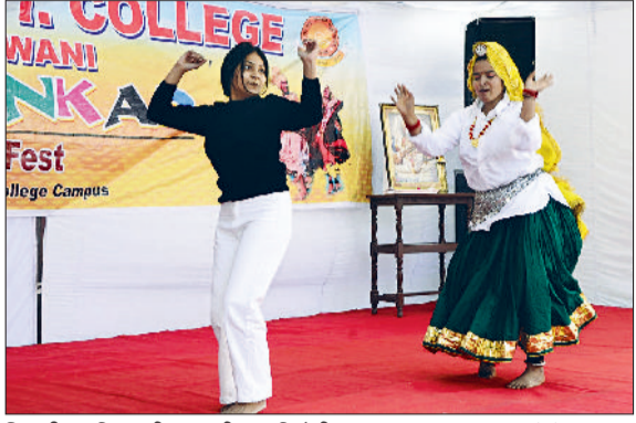
मिवानी। हरियाणवी नृत्य की प्रस्तुति देती छात्राएं।