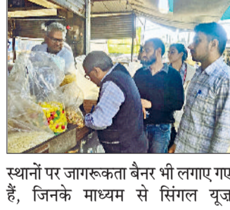
स्थानों पर जागरूकता बैनर भी लगाए गए हैं, जिनके माध्यम से सिंगल यूज