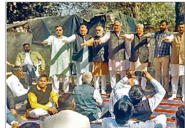
भिवानी। पद एवं गोपनीयता की शपथ लेते नवनिर्वाचित पदाधिकारी।