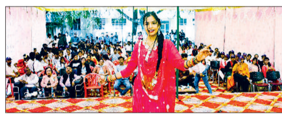
लोहारू। चौ. बंसीलाल कॉलेज में उड़ान उत्सव में प्रस्तुति देती छात्रा।