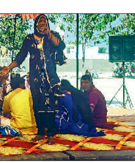
मिवानी। राजा उत्तानपाद-ध्रुव भगत सांग का मंचन करते कलाकार।